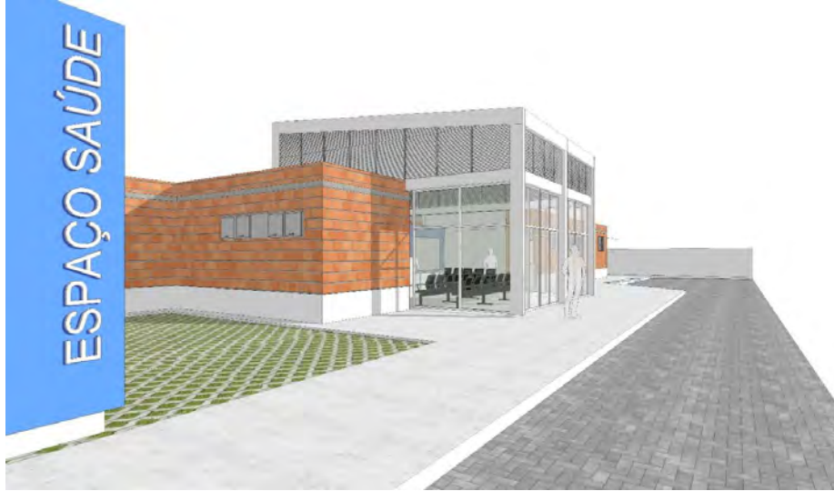
figura02 – Perspectiva