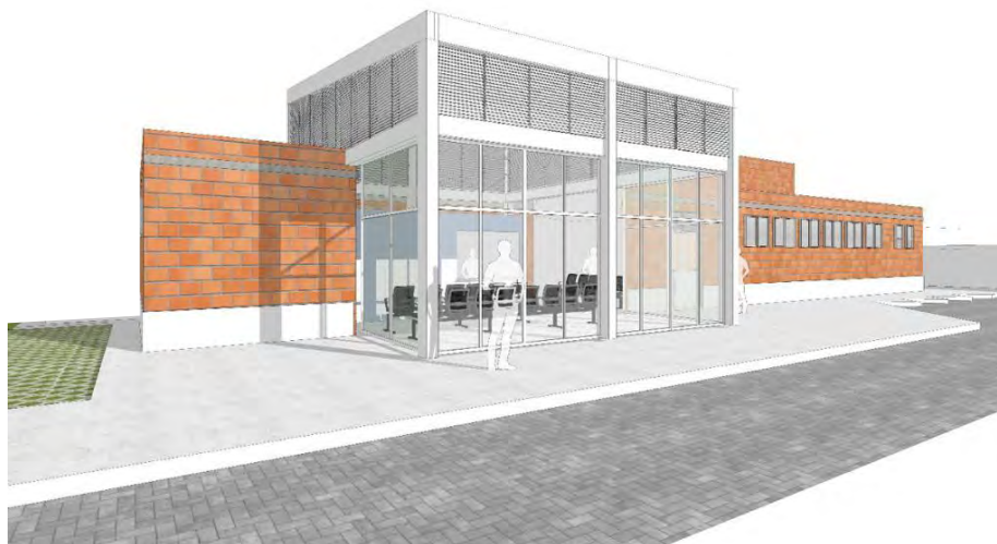
figura04 – Perspectiva